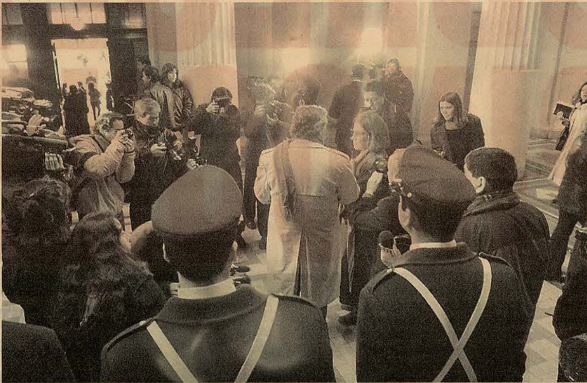
A las 10 AM la Corte estaba repleta de prensa nacional e internacional, que recogió las reacciones del fallo. A las 12.30 hubo una manifestación en el Paseo Ahumada de organizaciones de derechos humanos, en protesta por el sobreseimiento de Pinochet.

FALLO argumenta que no está en condiciones de ejercer los derechos que le garantiza la ley para un "debido proceso"... TRIBUNAL aplicó causal de "locura o demencia", pero aclaró que tales términos deben entenderse como los aplican los facultativos que examinaron al ex Presidente.