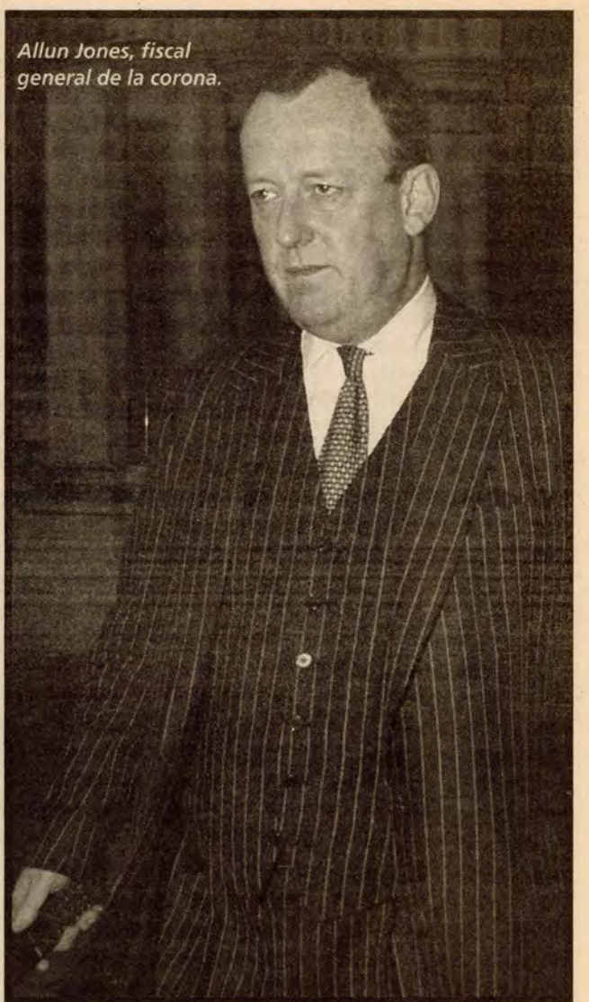
Allun Jones, fiscal general de la corona.

67.- En el caso de procesos criminales basados en actos cometidos en